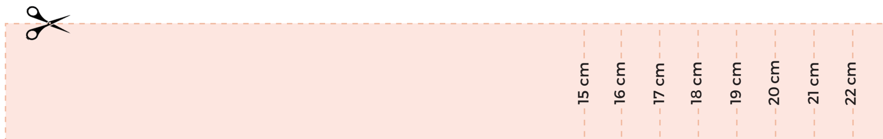
TABELLA DELLE MISURE